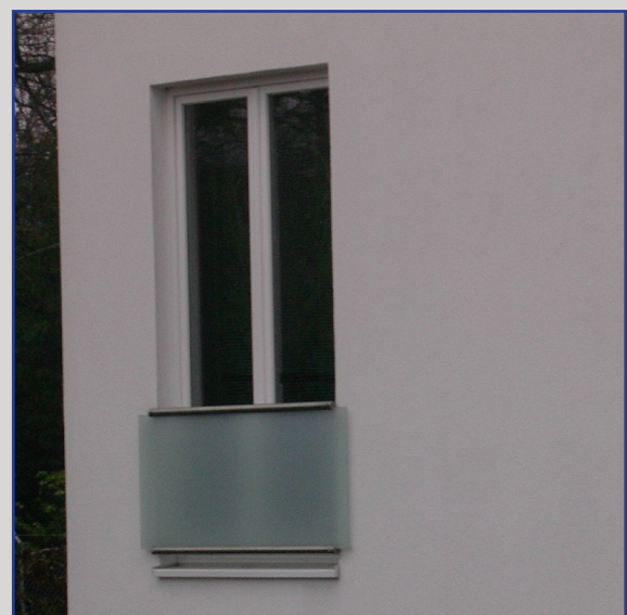
Ganzglasbrüstungen in der Fassade

Absturzsicherung bis 3000 mm Glasbreite und ab 300 mm Glashöhe. Befestigung im Mauerwerk oder im Fensterrahmen mit Profildübeln. Schlanker Kantenschutz an den Glasabschnitten.