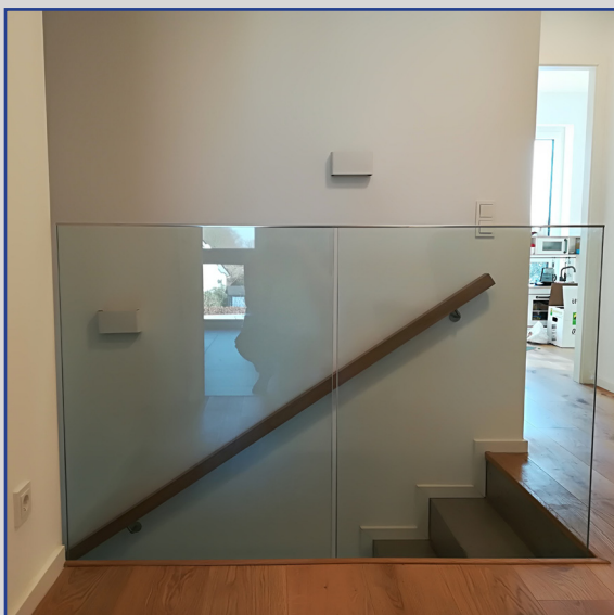
Ganzglasbrüstung im Innenbereich