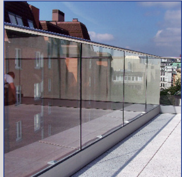
Brüstung aus Glas als Absturzsicherung